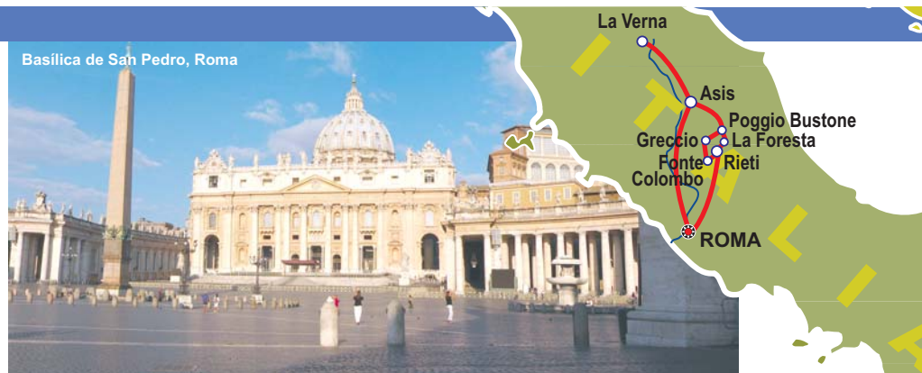
Basilica de San Pedro, Roma

San Francisco, de Santa Clara, Santa María Sopra Minerva, etc. Visita de San Damián , rodeada de cipreses y olivares, fue en esta pequeña iglesia donde San Francisco recibió la vocación; en ella murió Santa Clara en 1253. Oración y visita de los alrededores. subida en taxi al Santuario de las Cárcelas , en las laderas del Monte Subasio, lugar donde San Francisco se retiraba para la oración: Gruta de San Francisco, el Oratorio, la Ermita de la Magdalena, etc. Cena y alojamiento.