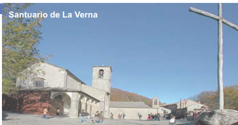
Santuario de La Verna

Desayuno. Por la mañana, visita con guía local, de los Museos Vaticanos , conocidos en todo el mundo por sus obras maestras que los Pontífices romanos han coleccionado y conservado durante siglos. Destaca el inmenso patrimonio de obras de arte así como lugares como la Capilla Niccolina, las habitaciones pintadas por Raffaello y naturalmente, la Capilla Sixtina con los frescos de Miguel Ángel. la Plaza de San Pedro, literalmente abrazada por la Columnata de Bernini, y la Basilica de San Pedro construida sobre la Tumba del Santo Apostol. Visita de las Tumbas de los Papas. Almuerzo. Por la tarde, visita con guía local de las Basílica Mayores: Basilica de San Juan de Letrán , Basilica de Santa María la Mayor , con su majestuoso interior que ha conservado su originaria estructura paleocristiana y la Basilica de San Pablo Extramuros , erigida en el año 314 y cuyo interior es de una grandiosidad imponente. Visita de la Basílica franciscana de Santa María de Aracoeli, erigida en el siglo VI sobre una antigua abadía bizantina. Cena y alojamiento.